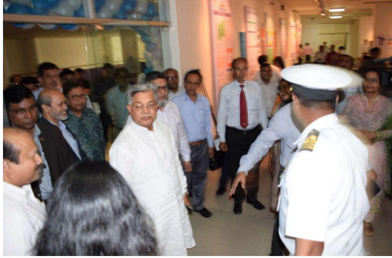
সম্মানিত অতিথিগণ কর্তৃক পাইলট উদ্যোগ পরিদর্শন (মেরিন একাডেমী)