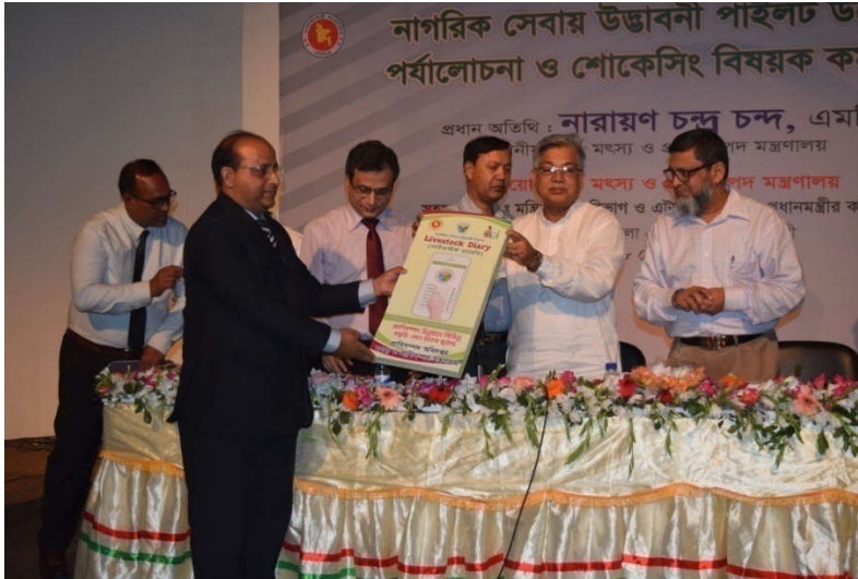
মাননীয় প্রধান অতিথি কর্তৃক লাইভস্টক ডাইরি মোবাইল অ্যাপস উদ্বোধন

উদ্যোগ ৩টির শুভ উদ্বোধন করেন। তিনি এসব কর্মকান্ডের ফলে তরুন কর্মকর্তাদের মাঝে সৃজনশীলতা, মেধা-বিকাশ ও