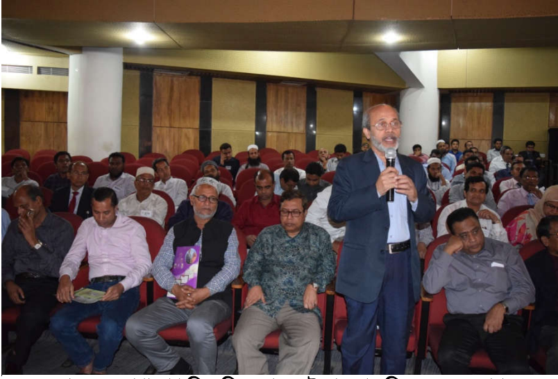
সংস্থাসমূহের প্রধানগণ নিজ নিজ দপ্তরের ইনোভেশন বিষয়ে বক্তব্য রাখছেন