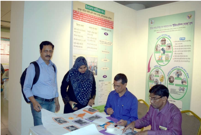
এটুআই প্রোগ্রামের প্রতিনিধিগণ কর্তৃক পাইলট প্রকল্প মূল্যায়ন গ্রুপ তৈরিকরণের কার্যক্রম

বিভিন্ন দপ্তরের সংস্থা প্রধানগণ পাইলট প্রকল্প দেখে সন্তুষ্টি প্রকাশ করেন। ইনোভেটরদের উদ্যোগী পাইলট প্রকল্পের কাজ এবং সুন্দর উপস্থাপনার জন্য সকল উদ্ভাবকদের প্রশংসা করেন। তাঁরা উল্লেখ করেন যে, উদ্ভাবকগণ শিক্ষানবিশ এবং অপেক্ষাকৃত কম অভিজ্ঞ। তাই তাদের সঠিকভাবে গাইড করা উৎসর্জন কর্মকর্তাদের দায়িত্ব। এ বিষয়ে মন্ত্রণালয় প্রয়োজনীয় সংখ্যক মেন্টর নিয়োগের পদক্ষেপ নিবে।