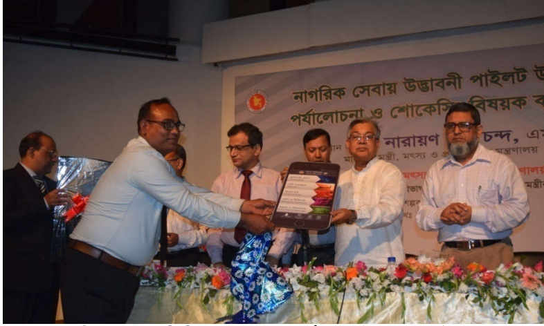
মাননীয় প্রধান অতিথি কর্তৃক মৎস্য বার্তা মোবাইল অ্যাপস উদ্বোধন।

প্রধানমন্ত্রীর কার্যালয়ের একসেস টু ইনফরমেশন (a2i) প্রোগ্রাম, মন্ত্রিপরিষদ বিভাগ এবং মৎস্য ও প্রাণিসম্পদ মন্ত্রণালয় এর যৌথ আয়োজনে এ ইনোভেশন শোকেসিং অনুষ্ঠানে ৩টি পাইলট উদ্যোগ মাঠ পর্যায়ে রেল্লিকেশনের লক্ষ্যে উদ্বোধন করা হয়। উদ্যোগ তিনটি হলো-