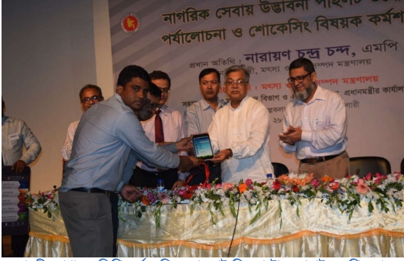
মাননীয় প্রধান অতিথি কর্তক বিএলআরআই ফিডমাস্টার মোবাইল অপ্লিকেশন উদ্বোধন।