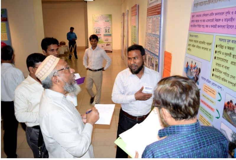
মন্ত্রণালয়ের অধিনস্থ বিভিন্ন দপ্তরের সিনিয়র কর্মকর্তা কর্তৃক পাইলট পরিদর্শন ও মূল্যায়ন