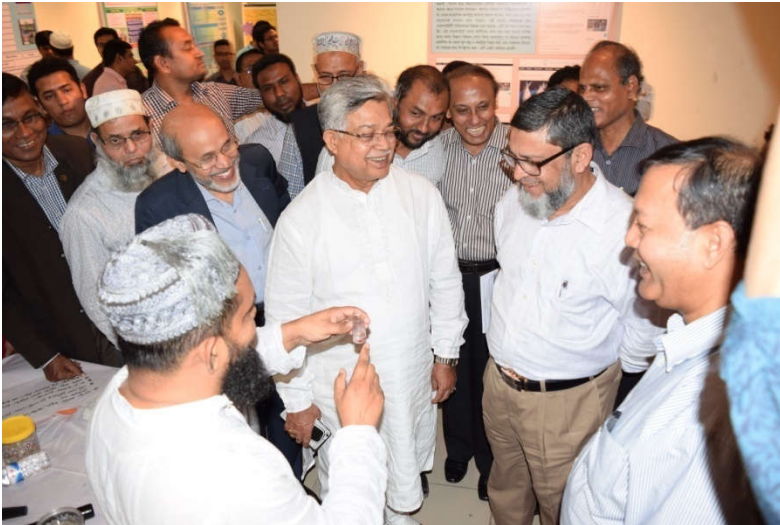
সম্মানিত অতিথিগণ কর্তৃক পাইলট উদ্যোগ পরিদর্শন (মৎস্য)

কর্মশালার শেষ সেশনে শোকেসে উপস্থাপিত উদ্ভাবনী আইডিয়াসমূহ মাননীয় প্রধান অতিথি, বিশেষ অতিথি মৎস্য